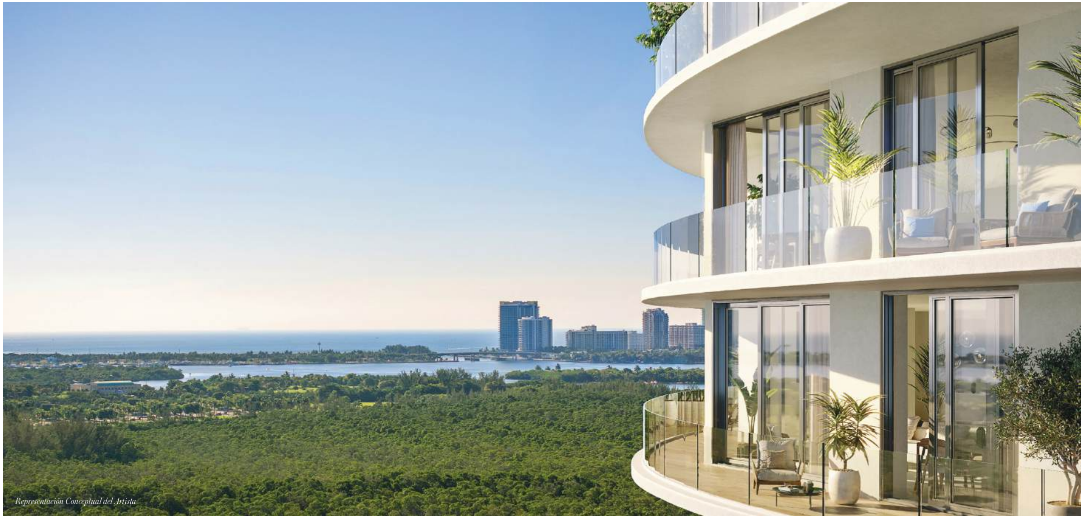
Representación Conceptual del Artista