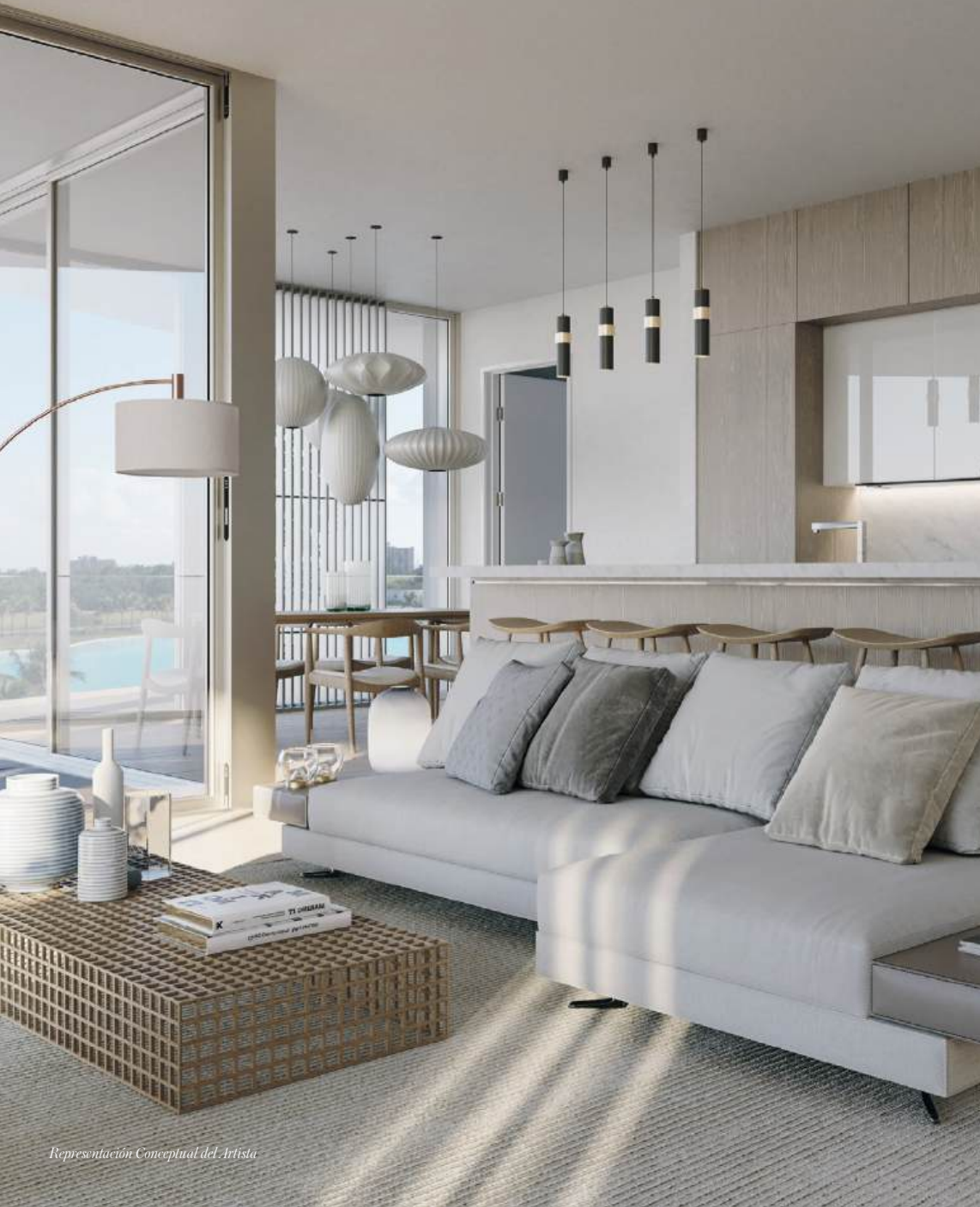
Representación Conceptual del Artista

Las paredes con ventanas del piso al techo permiten abundante luz natural en todas partes, iluminando los interiores de los condominios de Meyer Davis Studio con acabados de diseñador en una paleta suave y neutra.