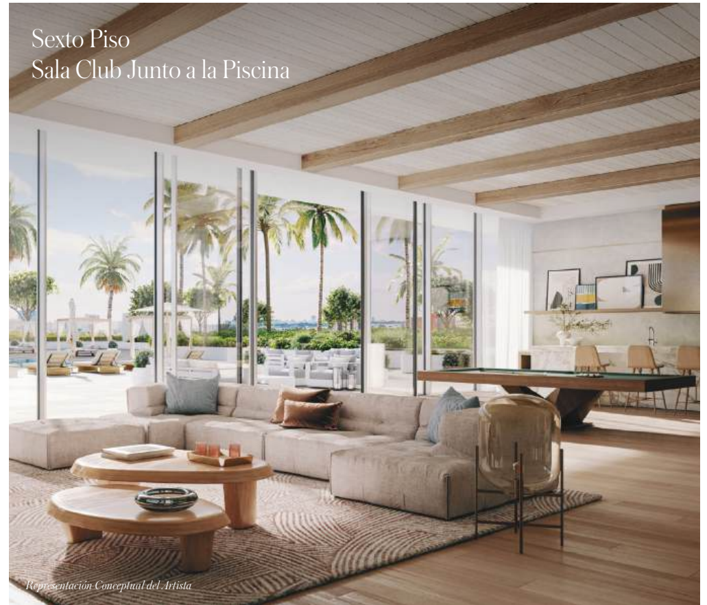
Sexto Piso Sala Club Junto a la Piscina