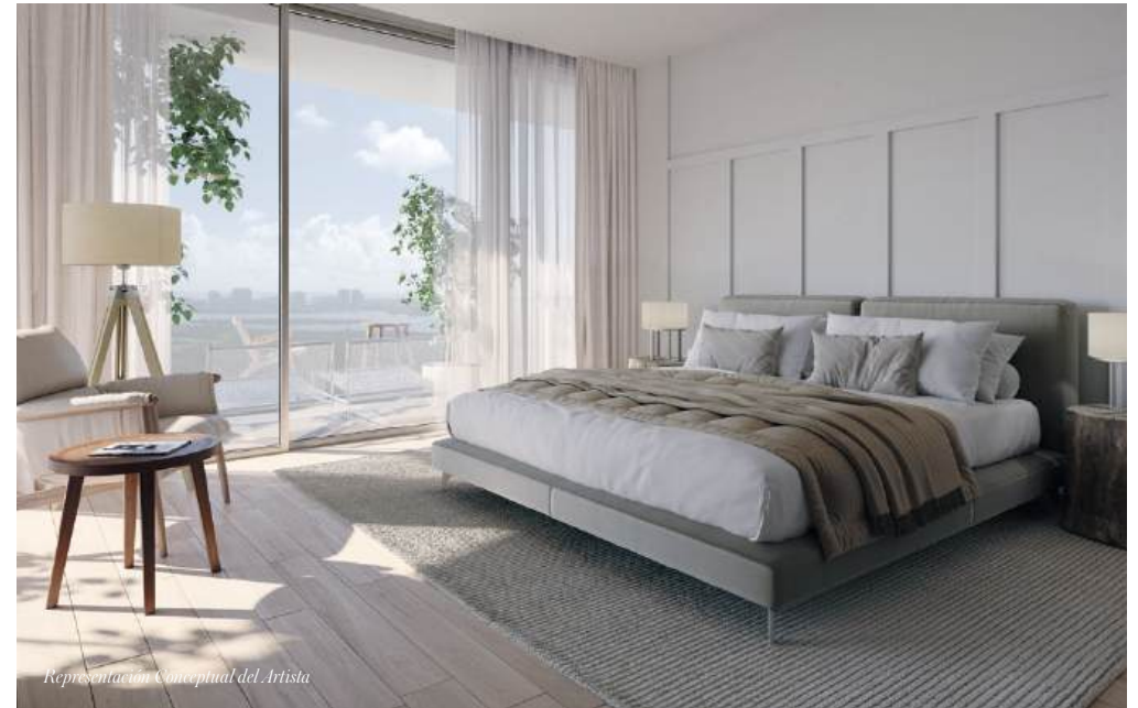
Representación Conceptual del Artista

Interiores elegantemente diseñados por Meyer Davis Studio con impresionantes vistas panorámicas del Océano Atlántico, Biscayne Bay, el Parque Estatal Oleta River, el horizonte de Miami y la Laguna SoLé de siete acres. Espaciosas plantas totalmente acabadas con techos de más de 9 pies de altura que se abren a una gran planta privada acabada, balcones envolventes con barandillas de cristal para una vida interior-exterior sin interrupciones.