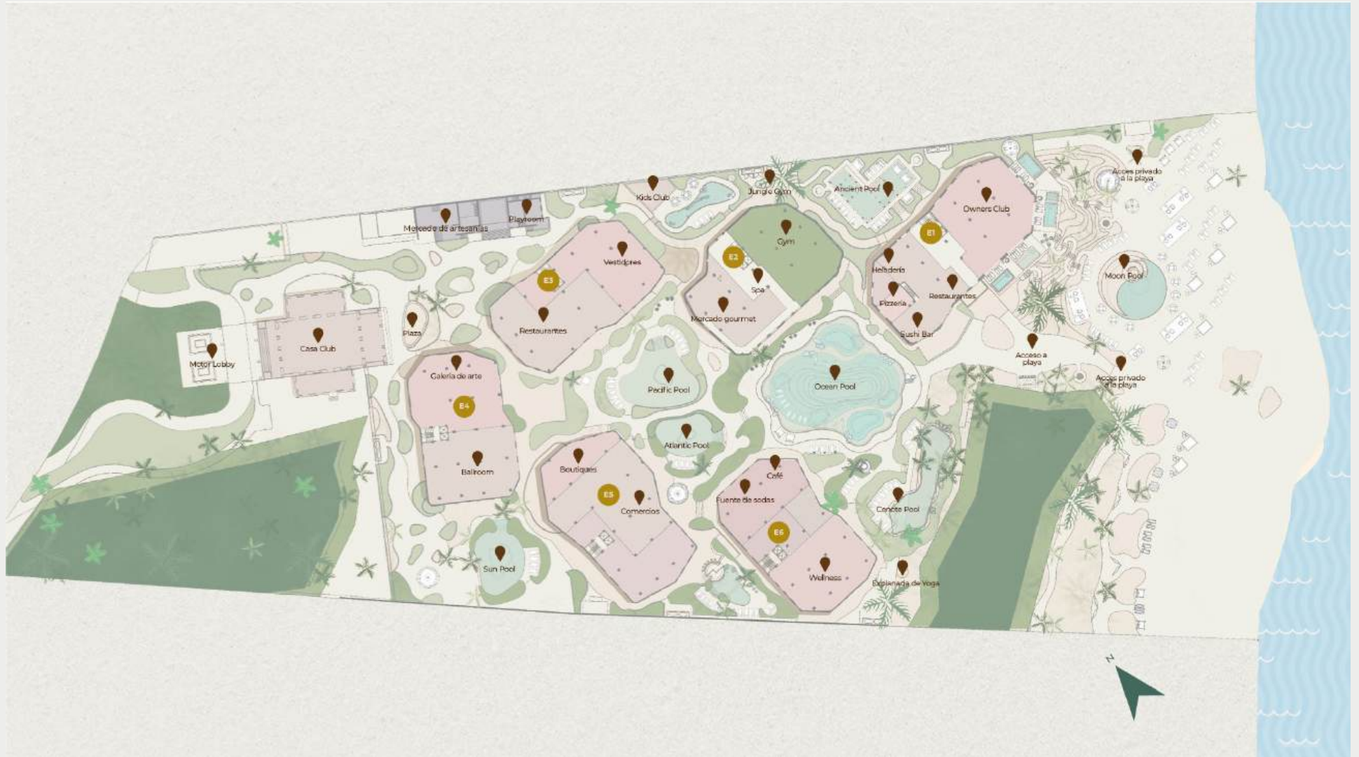
MASTER PLAN DE COSTA RESIDENCES & BEACH CLUB